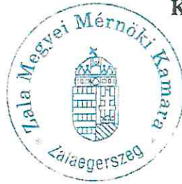
Kiss Attiláné titkár