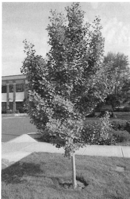
2.kép Ginkgo biloba – páfrányfenyő

Az Arborétum I. Székelykapunál lévő zöldterületére a már meglévő páfrányfenyő mellé még egy páfrányfenyőt terveztünk. A páfrányfenyőt (2. kép) 200 millió éves őskövületnek is nevezzük. Levele őszi aranyárgára színeződik. Télálló, a városi klímát jól tűri.