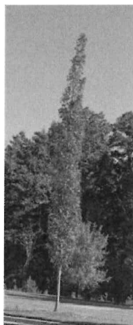
3. kép Liquidambar styraciflua 'Fastigiata' – oszlopos amerikai ámbrafa