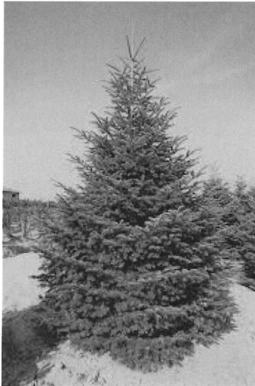
4.kép Abies nordmanniana

A parkba 3 darab kaukázusi jegenyefenyő hármaskötésbe, 10-10 méteres térállásba telepítve nagy színfoltja lehet a parknak (4. kép).