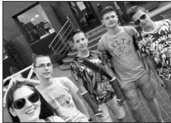
A békefutás zalakárosi résztvevői.

A Móra-iskolában tett látogatást mellett város-felfedező játékkal, keszthelyi kastélylátogatással, a Balaton megtekintésével, és az is-