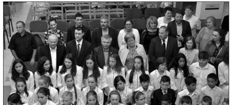
A települések polgármesterei, jegyzői is dalra fakadtak.