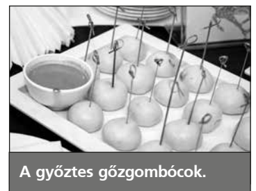
A győztes gőzgombócok.