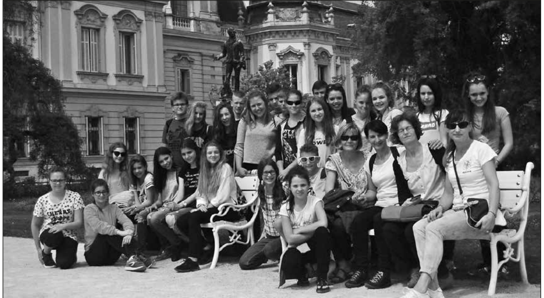
Olesnoi és zalakárosi diákok a keszthelyi Festetics-kastély előtt.

gyen részt. A sportos küldöttség látogatását örömmel fogadták a helybeliek, akik ugyancsak izgalmas programokkal kedveskedtek a magyar barátoknak. Bemutatták váro-