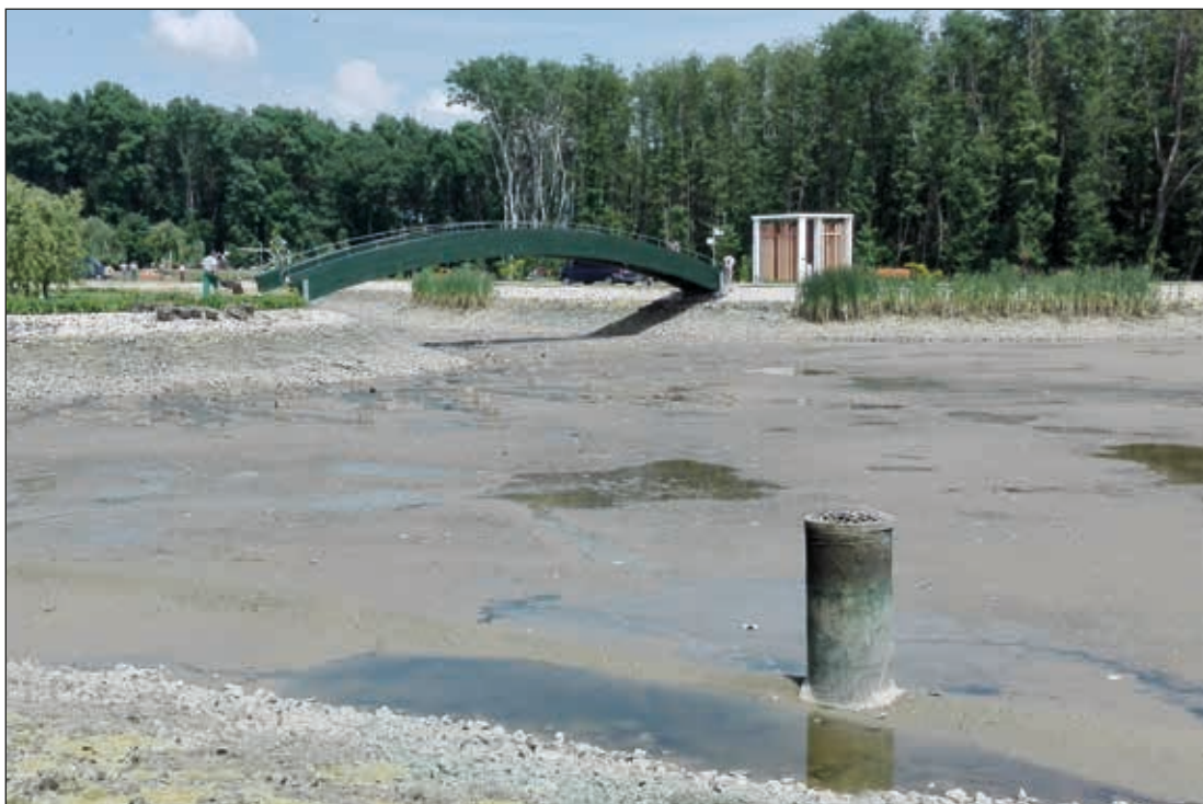
A tó a szakértői vizsgálat befejezéséig víz nélkül marad.

A tó állatvilágban nincsenek védett fajok, a itt élő békék, apró