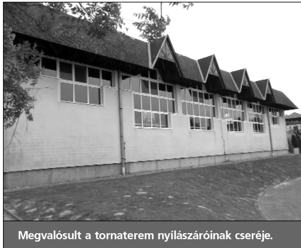
Megvalósult a tornaterem nyílászáróinak cseréje.