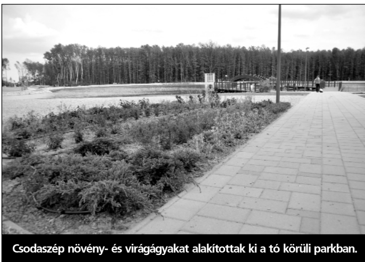
Csodaszép növény- és virágágyakat alakítottak ki a tó körüli parkban.