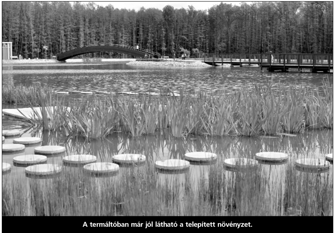
A termáltóban már jól látható a telepített növényzet.

A mi dolgunk csupán annyi, hogy óvjuk és vigyázzuk ezt a parkot, mely a növények növekedésével mind pompásabb látványt nyújthat mindannyiunk számára.