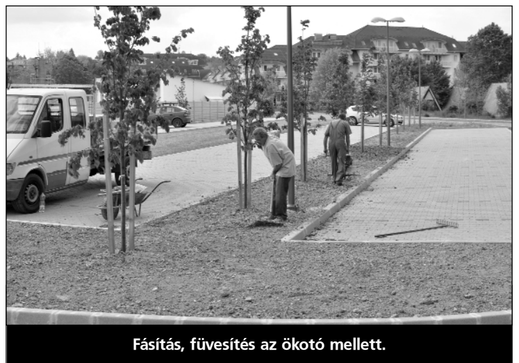
Fásítás, füvesítés az ökotó mellett.