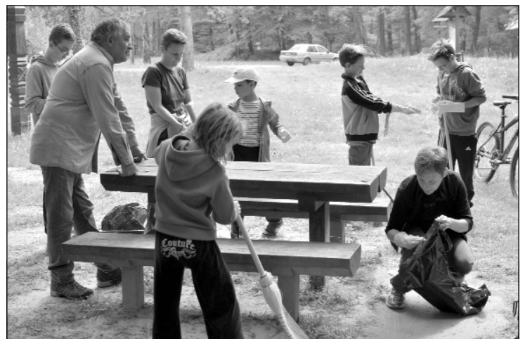
Az esőbeálló környékének rendbetételét is vállalták a résztvevők.

gén frissítővel és finom pörkölttel várták, s jutott idő még közös játékra, erdei kirándulásra is. A résztvevők megvendégeléséhez a Zalaerdő Zrt. is hozzájárult, támogatásukat ezúton is köszönik a szervezők.